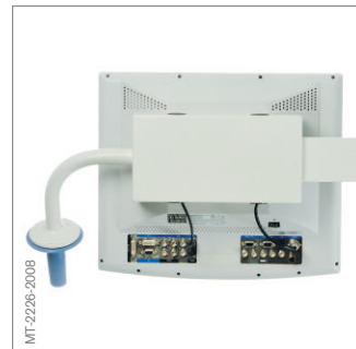
También disponible como adaptador doble para pantallas planas